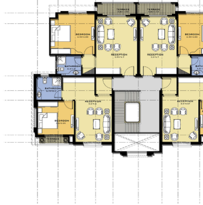
First Floor Plan