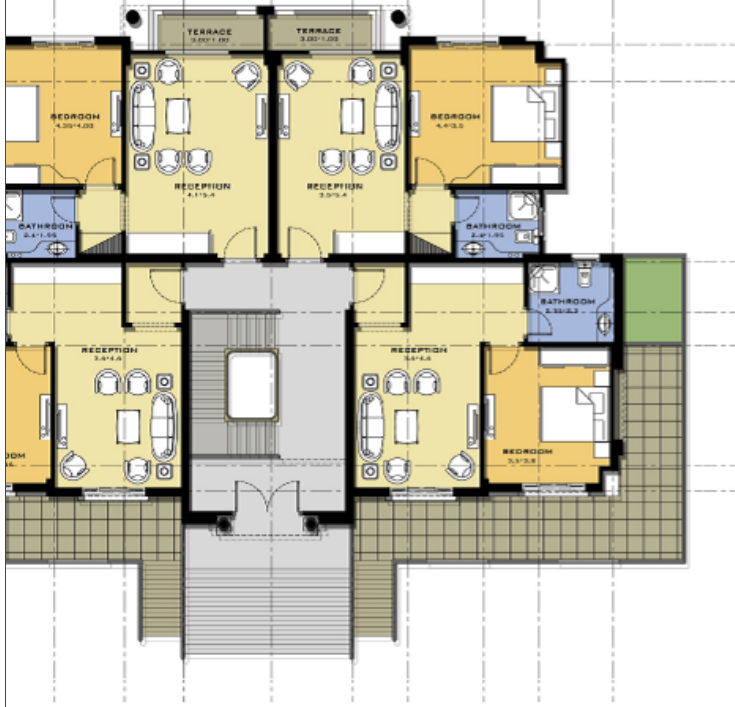
Ground Floor Plan